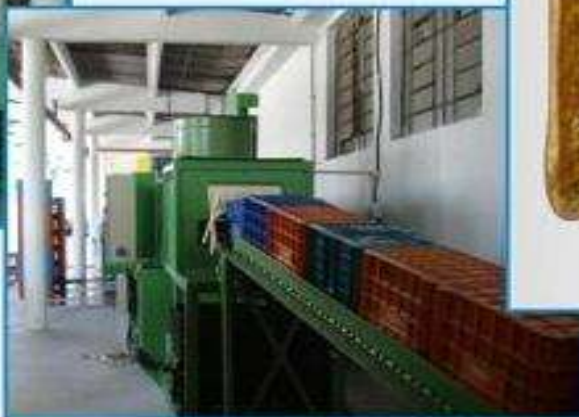
Processo de Higienização